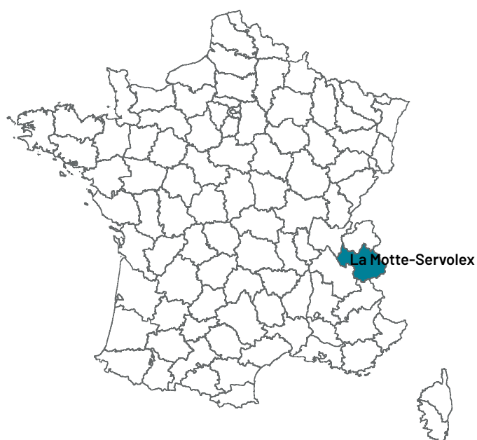
Localisation de la commune de projet