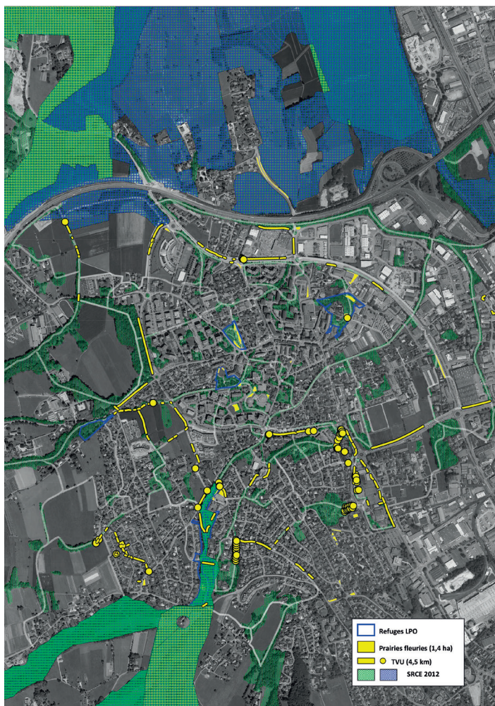
Plan d'action « Biodiversité en Ville » 2015-2022