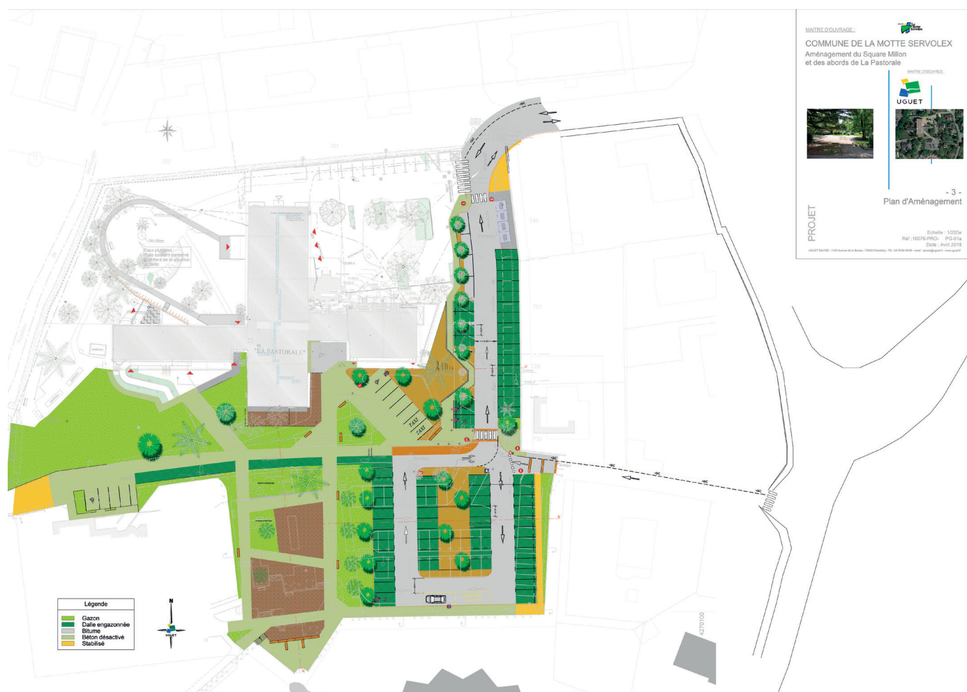
Plan de réaménagement du square