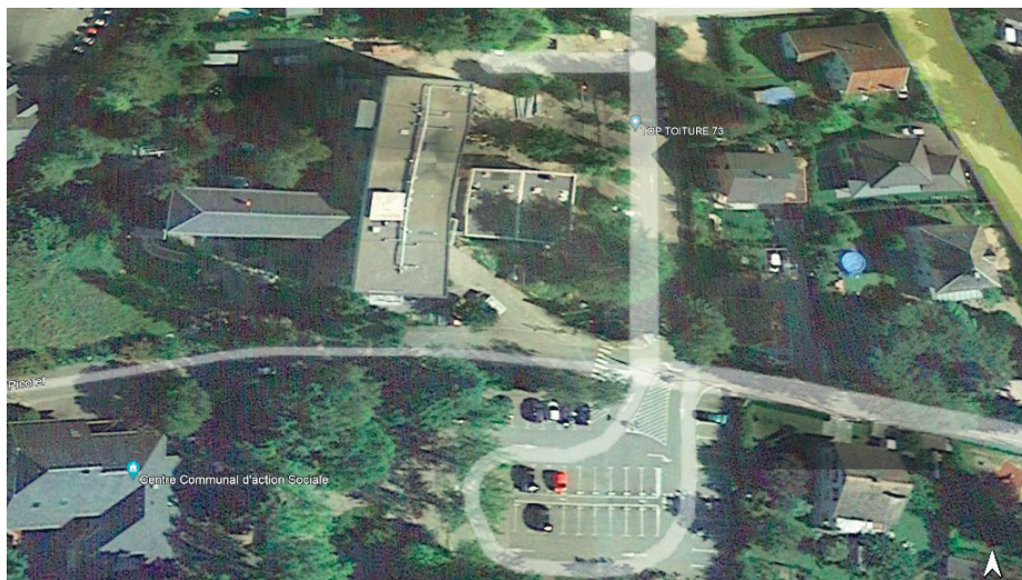
Vue aérienne du square Millon avant les travaux de désimpermeabilisation