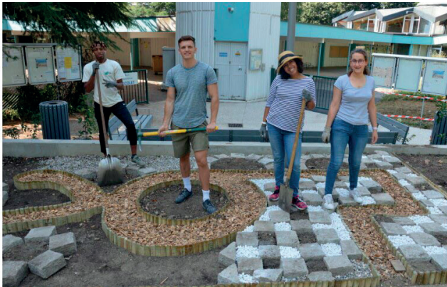
Chantier Concordia

En complément de ces travaux de réaménagement de la place, la ville a voulu apporter de nouveaux usages au sein de cet espace public :