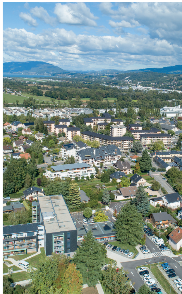
Vue aérienne du square Millon après les travaux de désimpermeabilisation