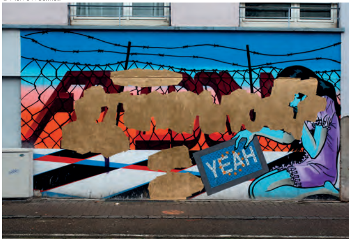
Mathieu Tremblin & Co, Mauvaise restauration « Freedom », 2020, rue Saint-Michel, Strasbourg. © Mathieu Tremblin.